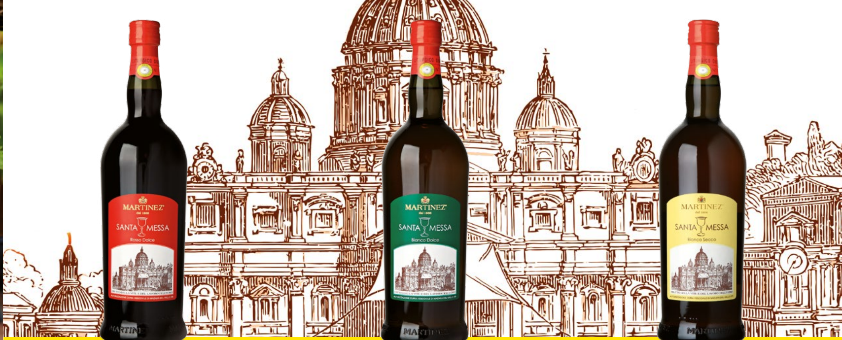
VINO SANTA MESSA ROSSO DOLCE